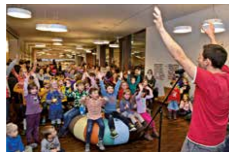
9. Int. Tag der Kinderrechte