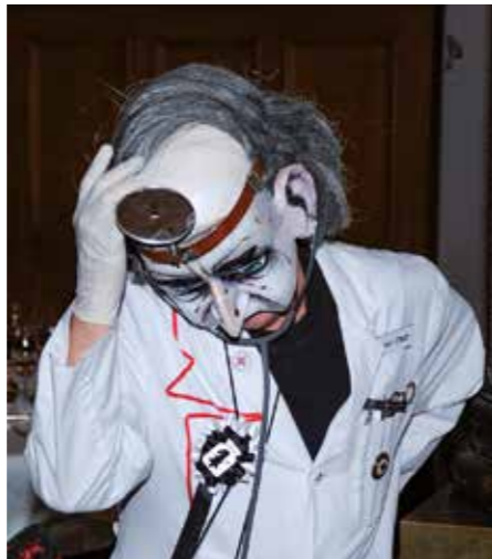
8. Charity Gala, Dr. FMH