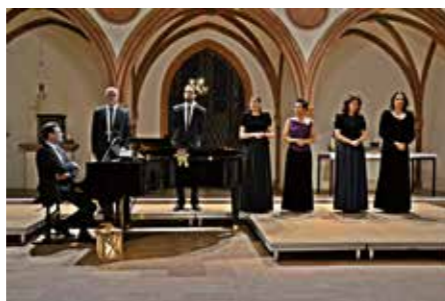
5. Benefizkonzert, Riccardi